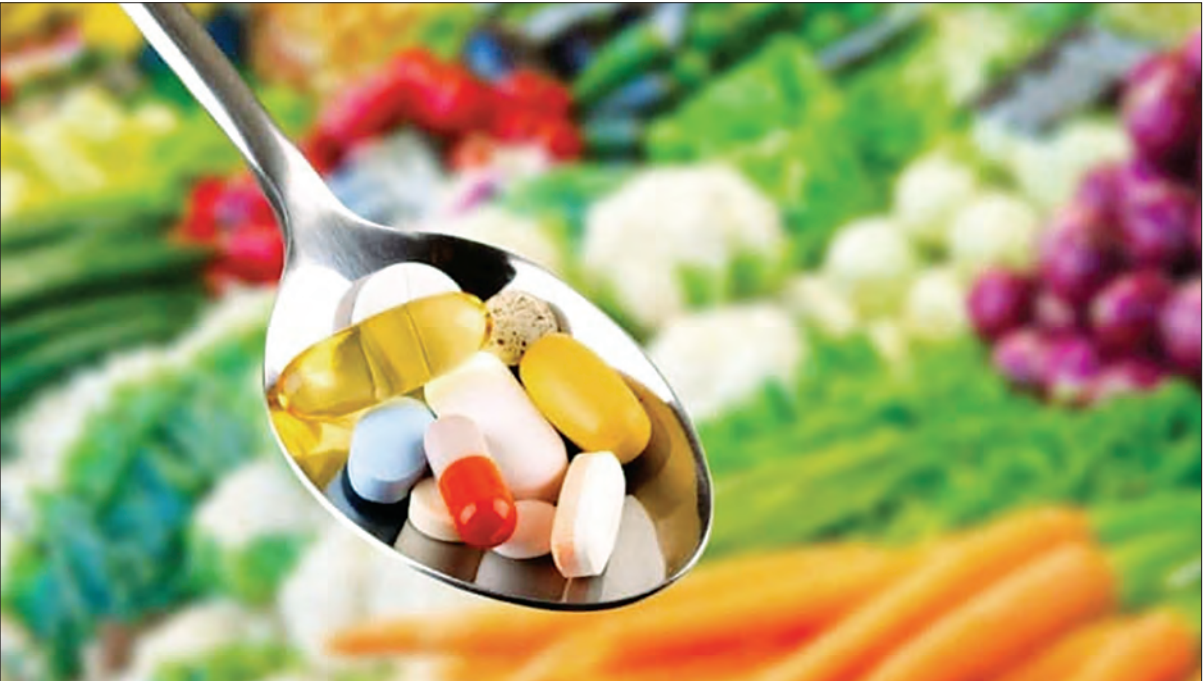
ویراستار عجزز دیانی